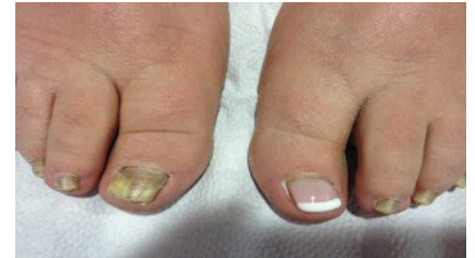
Schimmelnagel behandeling en verfraaiing