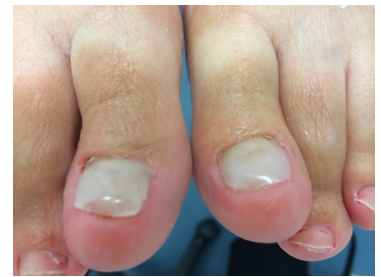
Nagelreparatie en verlenging Voor en Na